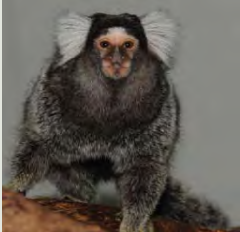
صورة ٢: وجد أن قرود الطمارين (القشة) Callithrix jacchus عرضة بصورة خاصة للتأثر بفيروس التهاب الدماغ و العضلة القلبية