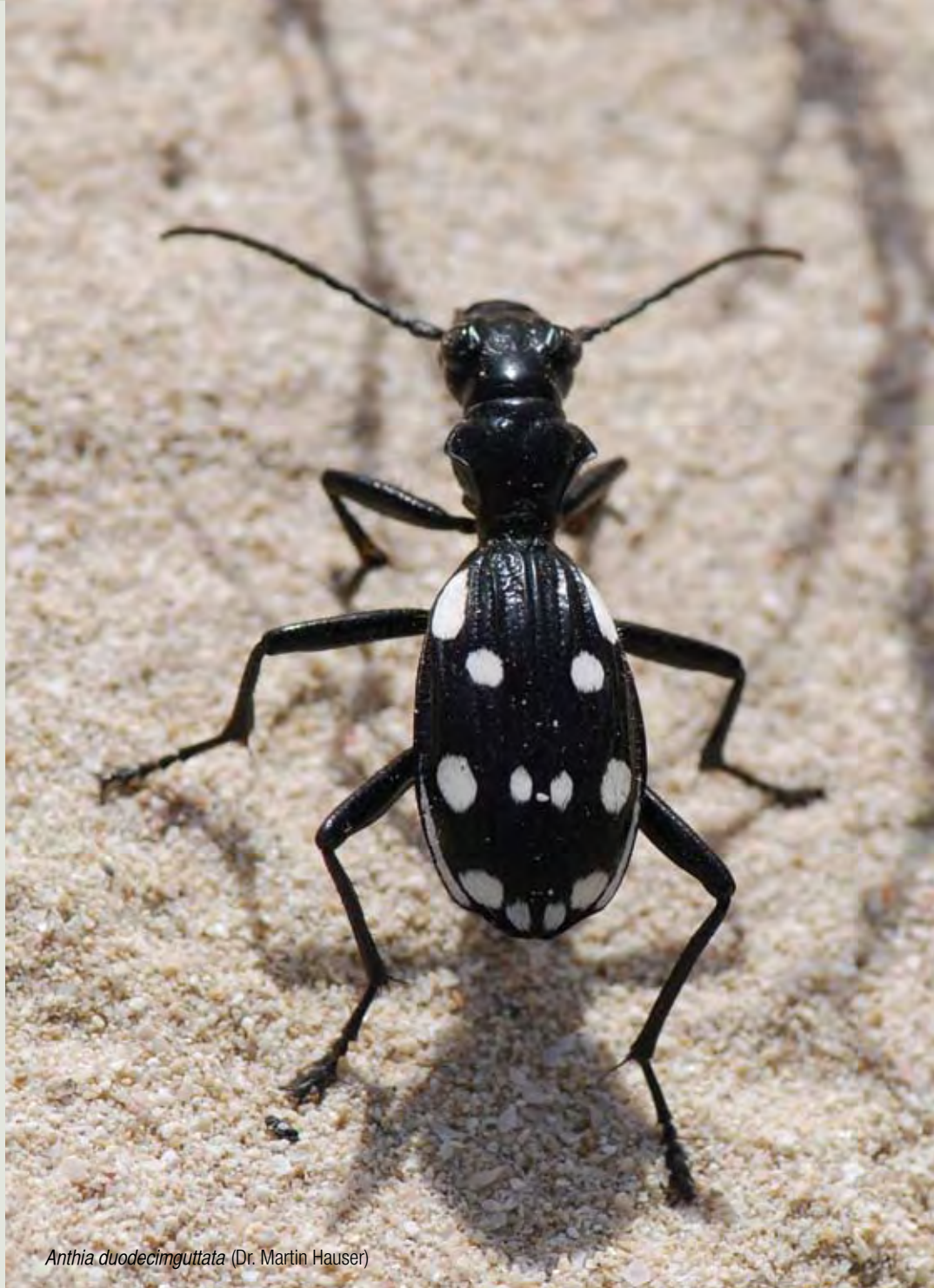
Anthia duodecimguttata (Dr. Martin Hauser)

نشرة أخبار الحياة البرية في الشرق الأوسط هي نشرة فصلية تحتوي على أوراق وتقارير ورسائل وأخبار مقدمة من بيطريين وعلماء أحياء ومن العاملين في مجال حماية البيئة ومتخصصين في تربية ورعاية الحيوان وآخرين عاملين في مجال الحياة البرية في منطقة الشرق الأوسط. المجلة ليست مسؤولة بالضرورة عن تلك المساهمات بالرغم من كل جهد بذل للتأكد من صحة المعلومات المحتواة. كما أن المحررين لا يتحملون مسؤولية تلك المساهمات والتي تعبر عن آراء كاتبها. إرشادات الكتاب متوفرة