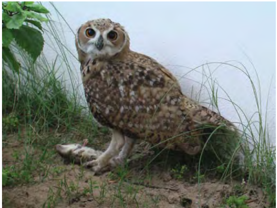
صورة ١: رغم تشجيع استخدام المكافحة البيولوجية، إلا أن اختيار السم المناسب هو أمر جوهري لتفادي التسمم الفرعي للحيوان غير المستهدف.

بعد مسح شامل للموقع وجدت الشركة أعشاشا لكلا نوعي الجردان (البني والأسود) ناشطة حول وفي ٩٠٪ من حظائر الحيوانات التي فحصت وكذلك في أماكن تخزين المأكّل والورش والمواقع المتعلقة بها. استنادا لأعداد الجحور والأعشاش والنشاطات اعتبر الغزو حادا للغاية وفق تقديرات محافظة ويقدر بالآلاف في منطقة المعالجة. عزيت الغزارة العالية إلى التوفر السهل للمال مصادر الطعام ومناطق الاختباء حول وفي الحظائر وسهولة الوصول إلى المباني. وجد أيضا أنه كانت قد جرت محاولات سابقة للمكافحة باستخدام عدة وسائل للاصطياد، كانت تلك المحاولات قد نجحت في اصطياد عدد كبير في مناطق محددة لكنها فشلت في نهاية الأمر لأنها سمحت بإعادة استيطان الجردان لتلك المناطق من حظائر مجاورة التي لم تكن محمية.