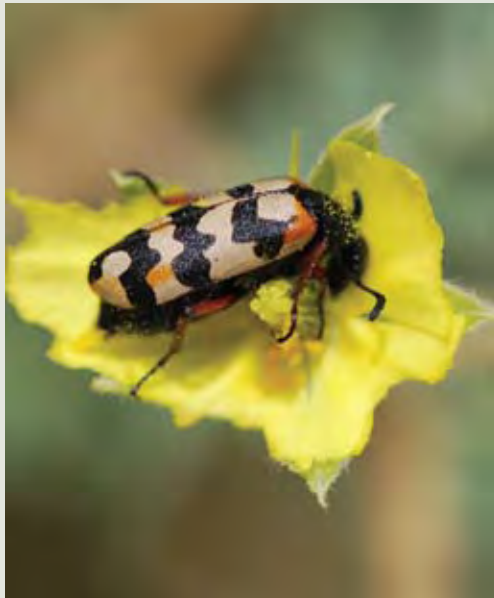
صورة ٢: Meloidae sp. (Martin Hauser)

لعل أكبر عائلة من قشريات الجناح أو حشرية الأجنح lepidoptera المسجلة في الكتاب هي الفراشات الليلية Noctuidae والتي سجل ١٦٩ نوعا منها في الإمارات كانت ثلاثة منها جديدة في العلم. ورغم أن كثيرا من الأنواع الطفيلية من رتب مختلفة كتلك التابعة لقشريات الجناح قد يكون لها تأثير اقتصادي خطير على الزراعة، فقد كان من المقلق بالنسبة للمجموعات الحيوانية العثور على يرقة واحدة من ديدان الأنف ( Oestrus variolosus ) في وعل Capra ibex nubiana . ورغم أن ذلك كان من عينة واحدة فإن هناك أدلة غير مؤكدة على إصابة المها العربي Oryx leuconyx بأنواع طفيلية مماثلة.