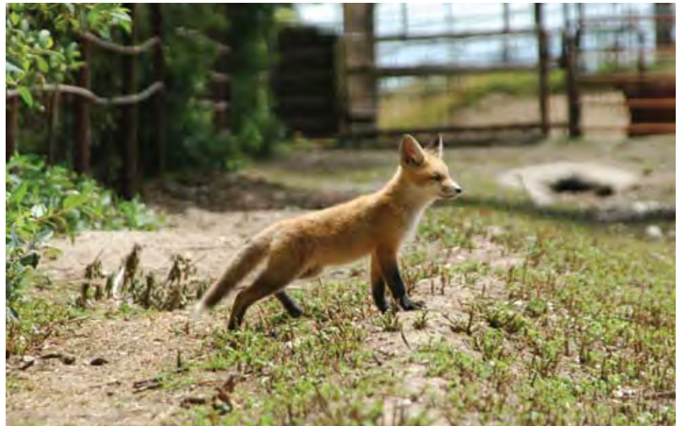
صورة ١: جرو ثعلب أحمر