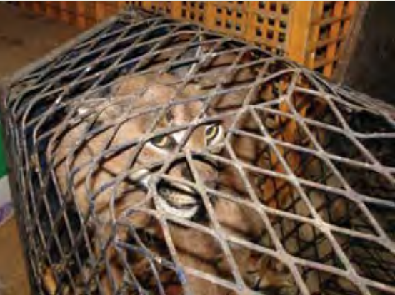
صورة ٢: كثيرا ما يباع وشق (سنور) اصطياد في البرية في سوق الحيوانات في نغم

ويقتنيها المشترون دون اعتبار للظروف المحزنة لإصطيادها (إذ يقوم الصيادون في العادة بقتل الأم بالرصاص) أو مشاكل رعايتها عندما تبلغ سن النضج. أخيرا، فإنني أظن أن الكثير من الحيوانات تعرض للبيع مجرد أن الصياد قد تمكن من القبض عليها، فقد عرض طيري غرة مائتين ( Fulica atra ) للبيع خلال أسبوع ١٦ إبريل وبقيا في السوق دون بيع لشهرين إلى أن نفقا.