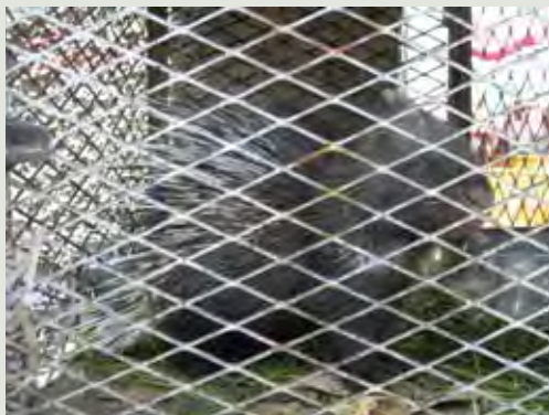
صورة ٣: Porcupines are traded for food, medicine and ornamentation (TK).

ديفيد ب. ستانتون - ص.ب. ٧٠٦٩، صنعاء، الجمهورية اليمنية yos@y.net.ye - ylrp@yemenileopard.org هاتف محمول ٩٦٧٧٣٢٩١٦٢٨ +