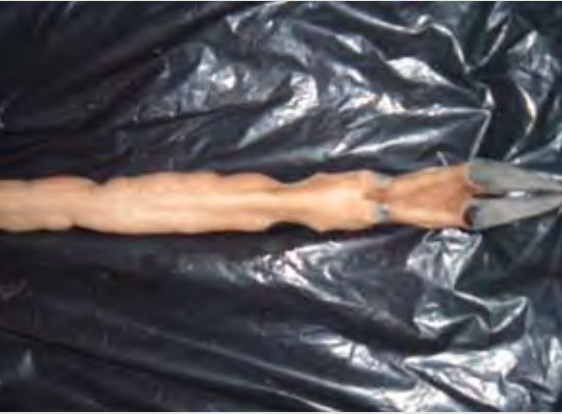
صورة ٢: مظهر بعد الموت لسنح طبي الجرينوك (Litocranius walleri) يظهر التكاثر السمحافي

Keighley Business Centre, South Street, Keighley, West Yorkshire, BD 21 1AG, United Kingdom