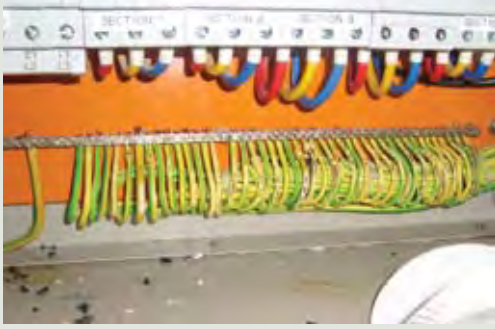
صورة ٢: Rat damaged electric wire (Dinesh, NPC)

يمثل الجردان في الثقافة الصينية الإمبراطورية أول حيوان من اثني عشر حيوانا تمثل دائرة الأبراج، بينما يعتبر في المعتقدات الهندية مطية الإله جاننش، وتشاهد تماثله دائما في معابد هذا الإله. أما في معظم الثقافات الأوروبية الحديثة فإن الجردان يمثل في معظم الحالات آفة أو حيوانا ضارا.