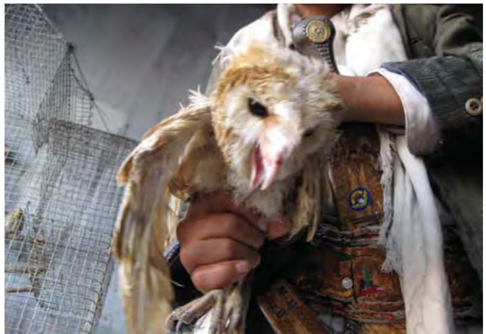
صورة ١: حالة بوم الهامة هذه مثال للحيوانات التي تباع في سوق الحيوانات في نغم

يشترى الزبائن الحيوانات لعدة أسباب: تفضل طيور التُّحاحي المُعَرَّد ( Carduelis yemenensis )، مثلا، كطيور للأقفاص، لأنها الطيور اليمنية الوحيدة التي تُعَرَّد في الأسر. تكتسب بعض الطيور الأخرى كالرفراف رمادي الرأس ( Halcyon leucocephala ) قيمتها لطرفتها. تستخدم أنواع أخرى في الطب التقليدي - إذ يُظن أن دم النيص يشفي من مرض السكري عند تناوله مع بعض العصير. ينتهي الأمر بأنواع أخرى بما فيها طائر الحجل وأرنب الصخور (الوير) والسمان وعدة أصناف من الحمام كوجبة على موائد مشتريها. تعتبر اليوم والصقور طيوراً فاتنة ورغم أن الأنواع الأعلى أسعارا كالشاهين ( Falco peregrinus ) لا تباع في نغم، إلا أن ما لا يقل عن ١٢ نوعا من الجوارح مرّت عبر سوق نغم في الشهور الثلاثة الماضية. من ناحية أخرى، تعتبر بعض الأنواع كصغار البايون جذابة