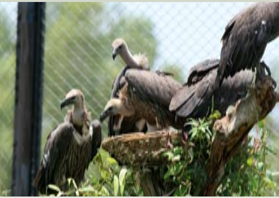
الشكل ١. النسر الشرقي أبيض الظهر ( Gyps bengalensis )

المراجع متوفرة في هيئة ملفات بي دي إف على موقع أخبار الحياة البرية في الشرق الأوسط.