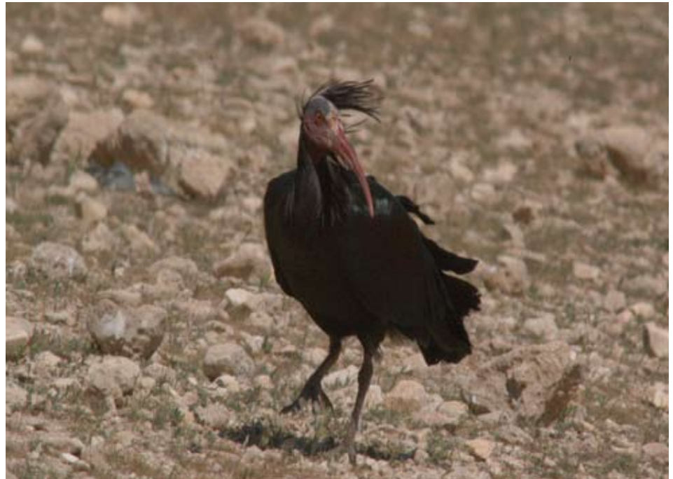
الشكل ١. طائر أبو منجل الأصيل الشمالي

تهاجر المجموعة بعد موسم التكاثر إلى مشتى لم يكن معروفاً حتى فترة قريبة. تبدأ الهجرة في شهر يوليو/تموز، وتتم العودة إلى تدمر في منتصف فبراير/شباط. نجحت جمعية بيردلايف والجمعية الملكية بالتعاون مع وزارة الزراعة والإصلاح الزراعي السورية في يونيو/حزيران ٢٠٠٦، في الإمساك بثلاثة طيور بالغة وتزويدها بمرسلات التتبع بالأقمار الصناعية. بفضل مبادرة استخدام المرسلات تبين أن موطنها الشتوي هو في إثيوبيا مع وقفات قصيرة في اليمن، وأرتيريا، عبر الأردن، والسعودية، والسودان (أنظر Lindsell et al in press). وقد نظمت الجمعية الملكية حملة في شتاء عام ٢٠٠٦ لمراقبة واكتشاف الطيور في مشتاتها في إثيوبيا بالتعاون مع جمعية الحياة البرية والتاريخ الطبيعي الإثيوبية، وبتمويل جزئي من حديقة حيوان تشستر، وجمعية طيور الشرق الأوسط. اكتشفت الحملة أن الطيور تقضي الشتاء في مرتفعات إثيوبيا وأنه ليس ثمة أخطار تحديق بالموطن. لسوء الحظ، لم يعثر على أي صغار برفقة الطيور البالغة أثناء الحملة. تم تزويد أحد الأفرار بمرسل في عام ٢٠٠٧ وظهر أن الصغير يقضي الشتاء في سوريا على مقربة من موقع التكاثر. لسوء الحظ توقف المرسل عن العمل لأسباب غير معروفة. أصبح تزويد المزيد من الصغار بمرسلات على سلم