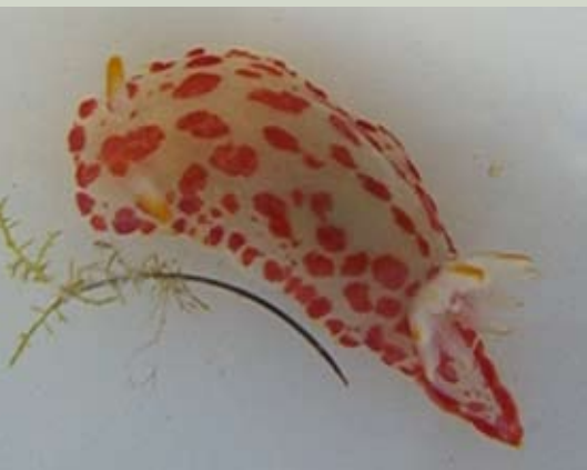
الشكل ١. نوع جديد في العلوم مدرجة تحت Chromodoris sp. 16 بانتظار الوصف

يمكنكم مشاهدة المزيد من الصور لهذا المخلوق الجديد، الذي كان من الأنسب العثور عليه في البحرين لأن ألوانه تماثل ألوان علمها الوطني، والحصول على معلومات إضافية عن البزاقات البحرية في موقع http://www.seaslugforum.net/display.cfm?id=19803