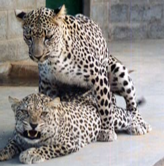
الشكل ١. نمور عربية ( Panthera pardus nimr ) تتزاوج

de Haas van Dorsser F.J., Green D.I., Holt W.V., and Pickard A.R. (2007). Ovarian activity in Arabian leopards ( Panthera pardus nimr ): مراقبة التصرفات الجنسية والستيرويد في البراز خلال الدورة الجريبية، التزاوج والحمل. التكاثر والخصوبة والتطور. Reproduction, Fertility and Development 19: 822-830.