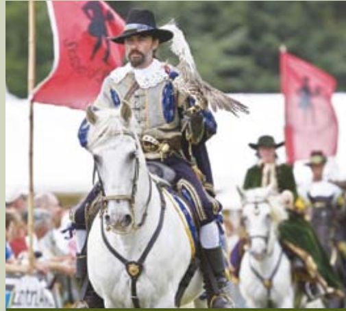
الشكل ١: صقار على صهوة حصان (Linda Wright)

سيستقبل المهرجان العالمي الثالث للصيد بالصقور إلى قلعة الجاهلي بالعين في ديسمبر ٢٠١١ للاحتفاء بهذه الرياضة العريقة. سيعرض هذا المهرجان المجاني، الذي سيمتد لأسبوع ويستضيفه نادي صقاري الإمارات، إسهام الصقارة في التعليم والعلم والفن والتراث.