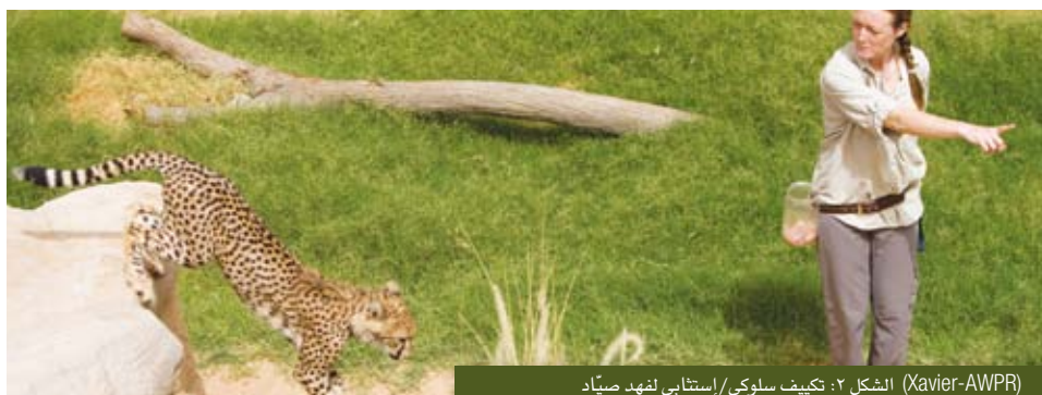
الشكل ٢: تكيف سلوكي/إستجابي لفهد صياد (Xavier-AWPR)

يستند البرنامج التدريبي للحديقة على مبادئ التكيف الاستجابي، وذلك باستخدام التعزيز الإيجابي كأداة رئيسية. تم تدريب العديد من الحيوانات آكلة اللحوم لدينا باستخدام التعزيز الإيجابي للمشاركة طوعا في مجال الرعاية الطبية الخاصة بهم، بما في ذلك علاج الجروح والحقن اليدوي للتطعيم السنوي. كما جرى تدريب العديد منها على الصعود إلى الميزان لأخذ وزنها كل شهر. كما أن التعزيز التدريبي الإيجابي يطبق من قبل موظفي التدريب لدينا عند تقديم برامج الحيوان للمجموعات المدرسية.