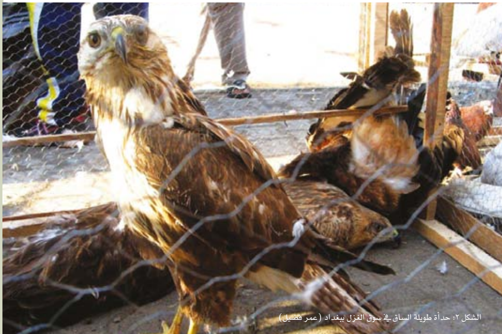
الشكل ٢: حدة طويلة الساق في سوق الغزل ببغداد (عمر فضيل)

في الزيارة الأولى لسوق الغزل في بغداد في ديسمبر ٢٠٠٨ وجدت أربعة أنواع من الطيور الجارحة. جرت دراسات أكثر تفصيلا في ٢٠٠٩ و ٢٠١٠ لتغطية أنواع الجوارح الرئيسية الموجودة في الأسواق سجل فيها وجود ٨٨٥ طيرا من ٣٦ نوعا. كانت