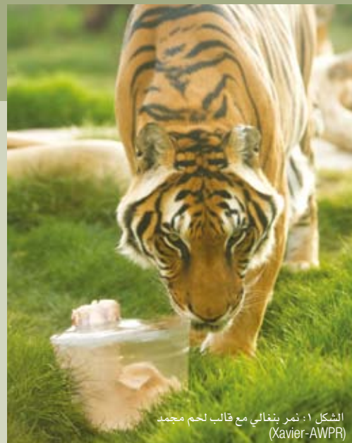
الشكل ١: نمر بنغالي مع قالب لحم مجمد

إن أحد أهداف لجنة التدريب والإثراء لدينا هو دمج الإثراء البيئي في روتين تربية كل حيوان، وتعريف موظفي الحديقة من جميع المستويات والإدارات بدورهم في البرنامج. يمكن إشراك جميع الموظفين من جميع الإدارات في إثراء الحيوان سواء بشكل مباشر أو غير مباشر. يقوم قسم البستنة لدينا بقص وتسليم العلف للرئيسات والحيوانات آكلة اللحوم وفق جدول أسبوعي. يقدم قسم التعليم برنامج الإثراء لمخيمات الحديقة في فصلي الصيف والشتاء، ويتعلم الأطفال في هذا البرنامج عن أهمية الإثراء البيئي ويعطون الفرصة لعمال الإثراء لتؤخذ وتقدم للحيوانات بينما يراقب الأطفال وقيّمون استجابتها