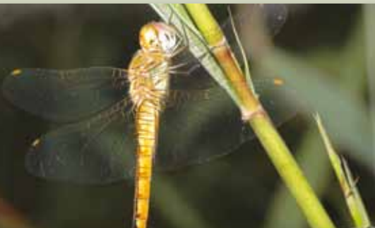
الشكل ٣: سجلت حشرة اليسوب في جزيرة السعديات

ينبغي إجراء مسوحات أكثر للحشرات البرية وغيرها من اللاقاريات في أوقات السنة التي تكون المجموعة فيها أكثر نشاطاً وفي وقت سيوفر معلومات أساسية أكثر دقة، كما أن إجراء المزيد من الدراسات/المسوحات في أوقات مختلفة من السنة، مع تقنيات جمع معدلة لموائل محددة سيضيف بالتأكيد الكثير من سجلات الحشرات وغيرها الأنواع المفصليّة إلى القائمة الحالية.