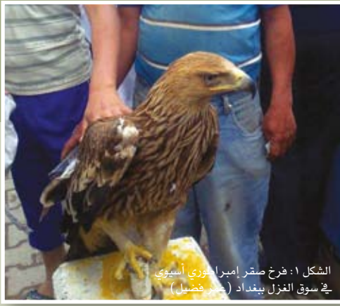
الشكل ١: فرخ صقر إمبراطوري أسوي في سوق الغزل ببغداد (عمر فضيل)

سبعة من تلك الأنواع مسردة ضمن الأنواع المهددة في القائمة الحمراء للأنواع للإتحاد العالمي لصون الطبيعة IUCN وكانت متوفرة في تلك الأسواق في كثير من الأحيان.