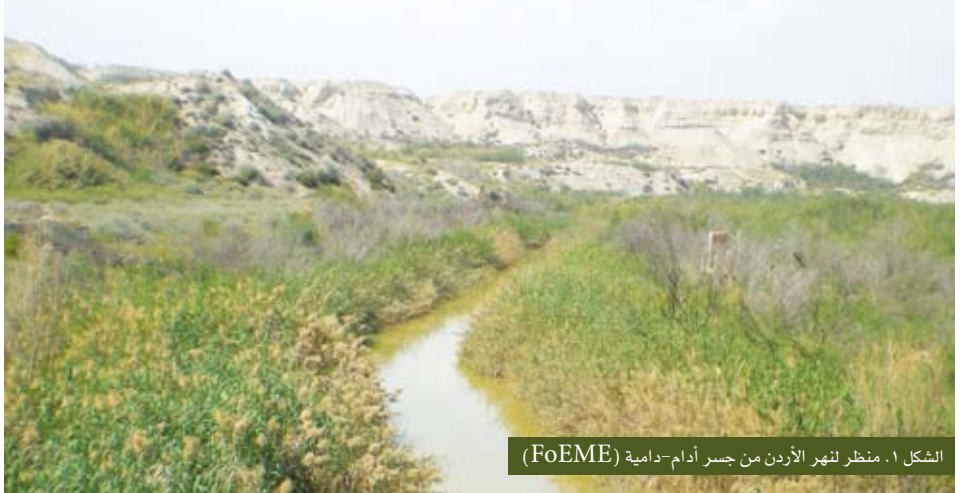
الشكل ١. منظر لنهر الأردن من جسر آدم-دامية

المنظمة هي نموذج لأفضل الممارسات البيئية لصنع السلام في منطقة الشرق الأوسط، يظهر كيف أن التعاون بين الأردنيين والفلسطينيين والإسرائيليين سيؤدي إلى التفاعل السلمي وإعادة التأهيل البيئي.