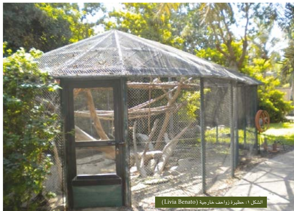
الشكل ١: حظيرة زواحف خارجية (Livia Benato)