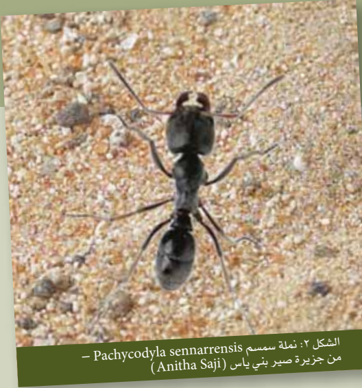
الشكل ٢: نملة سمس Pachycodyla sennarrensensis من جزيرة صير بني ياس (Anitha Saji)

إلا أن الرتب المدرجة حالياً تظهر غلبة غشائية الأجنحة وذوات الجناحين، وهذه الاكتشافات مماثلة لتلك الموجودة في موائل البر في دولة الإمارات العربية المتحدة. من الحشرات واللاقاريات التي ظهر غيابها من الجزر تلك التي ترتبط عادة بموائل محددة في البر. لم يكن هناك أنواع مستوطنة في الجزيرة، إلا أن تلك التي جرى تحديدها أظهرت أنها أقل وفرة مع توزيع غير متكافئ. وفقاً لـ Niemelä, et al (١٩٨٨) فإنه لا توجد علاقة واضحة بين قدرة أحد الأنواع على التبعثر وتواجده في الجزر-البر. قد يكون هذا التفسير الأكثر احتمالاً للتوزيع غير المتساوي لنوع خنفساء الطجن Tenebrionid الذي